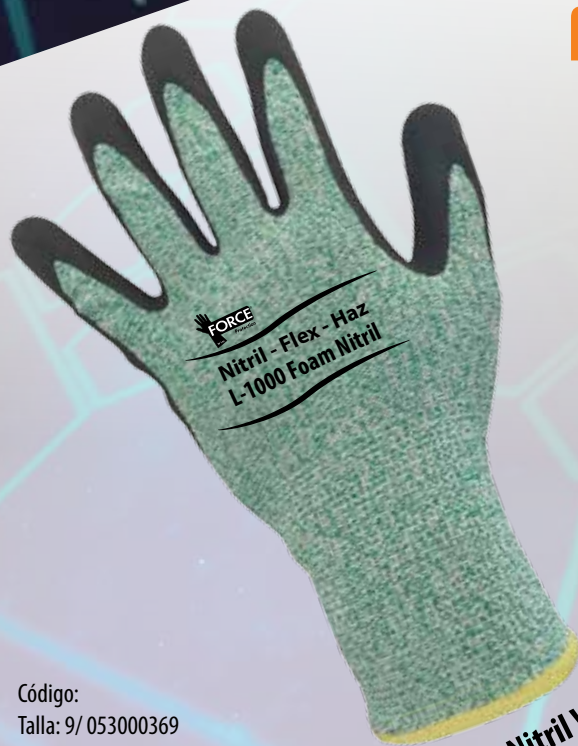
Foam Nitril Verde